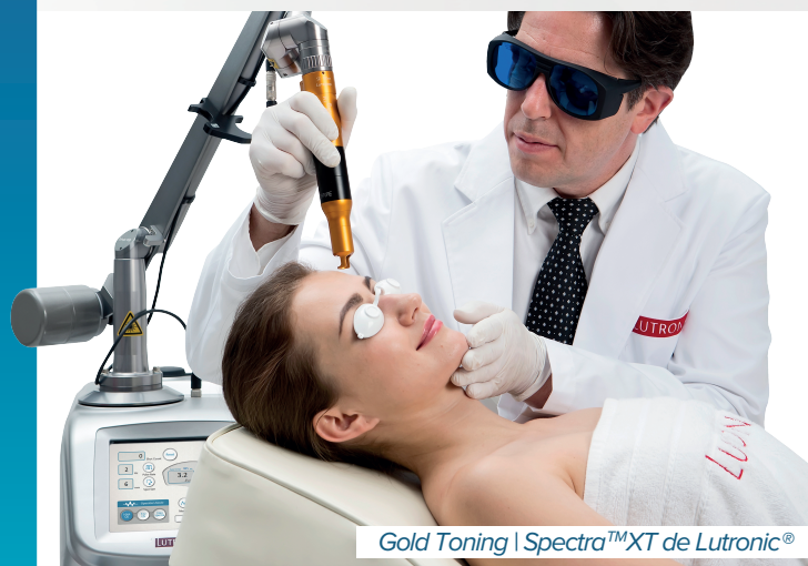
Gold Toning | Spectra™XT de Lutronic®